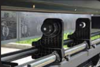
Medya Alma & Rulo Sistemi