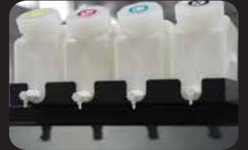
Kararlı, Düzenli ve Toplu Hızlı Yazdırma