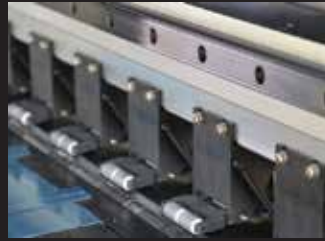
Yüksek Kararlılık, Yüksek Dayanıklılık